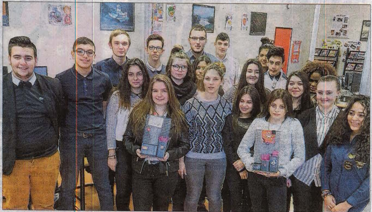
■ Les élèves de 1 re du bac pro commerce ont créé leur mini-entreprise autour de la création d'un vide-poches en acier "Made in Bérard", fabriqué par les élèves du CAP serrurier-métallier.

voir, fabriquer et commercialiser un produit. « Au départ, on avait 60 idées et plein de propositions farfelues, relatent les lycéens. Puis on a voté, on a sélectionné quatre objets et finalement, avec le principe de faisabilité et de recyclage de matériaux, on a retenu le vide-poches. Et une étude de marché nous a montré que 75 % des personnes interrogées étaient prêtes à acheter notre produit. »