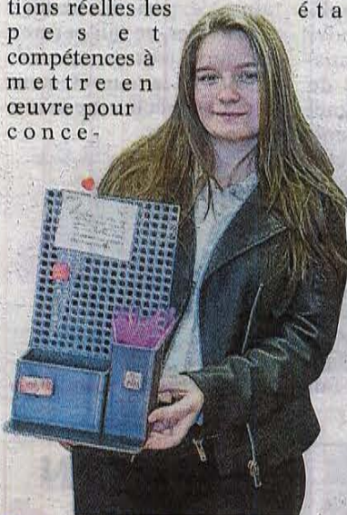
■ Le vide-poches en acier est verni à la main.

compétences à mettre en œuvre pour conce-